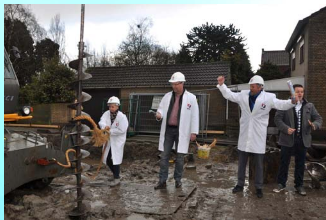
De Eerste Paal "geslagen" op 2 maart 2016

Voor dit ouderinitiatief zijn wij nog op zoek naar ouders die een actieve bijdrage willen leveren om voor hun kind een veilige woonvoorziening te creëren.