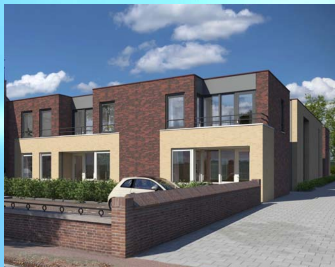
Artist's Impression van het complex

"BIJZONDER WAAR NODIG EN NORMAAL WAAR KAN"